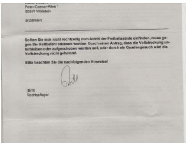
Ladung S. 2 001