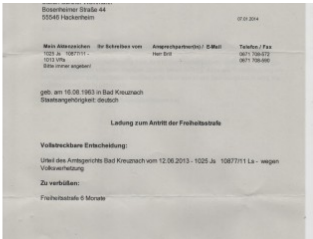
Ladung S. 1 001