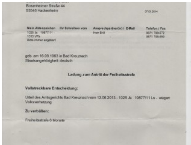
Ladung S. 1 001