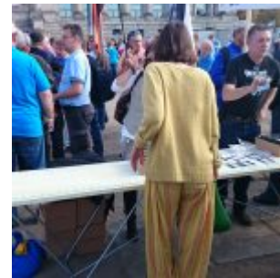
BRD GmbH Verkaufsstand