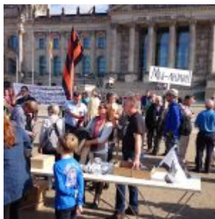
BRD GmbH Verkaufsstand