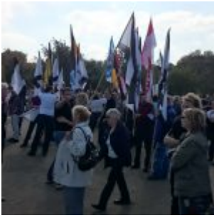
Vor dem Reichstag