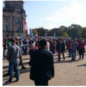
Vor dem Reichstag