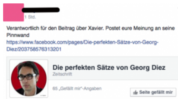
Shitstorm SPON - Xavier Beitrag

http://www.youtube.com/watch?v=C700V72bo5o