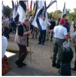
Vor dem Reichstag