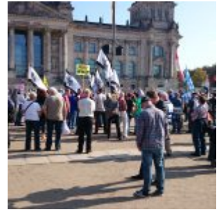
Vor dem Reichstag