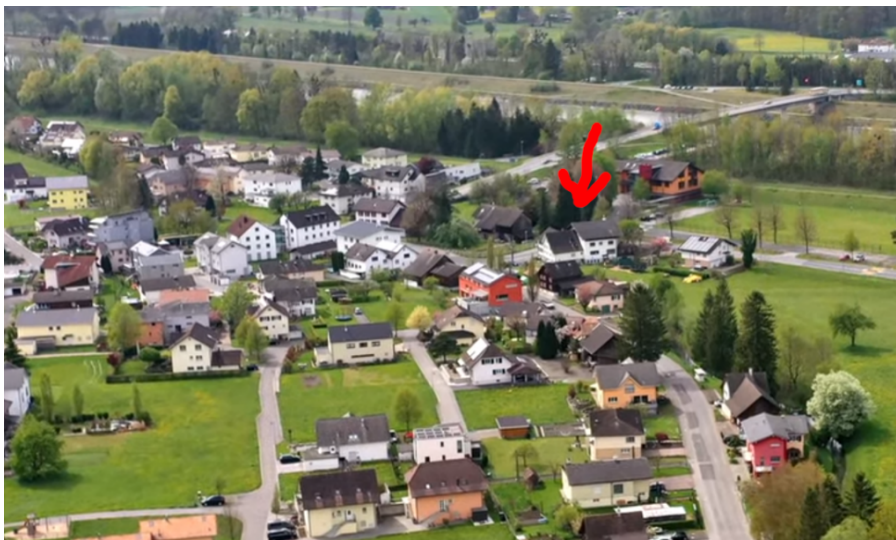
Ein Ortsteil von Ruggell mit dem Landgasthof "Rössle".