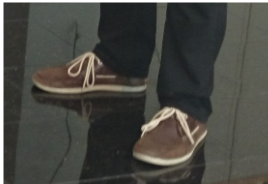
Das Fußvolk mit standesgemäßer Fußbekleidung

Tusch, Pauke und Trompete müssen, da gepfändet, leider entfallen.