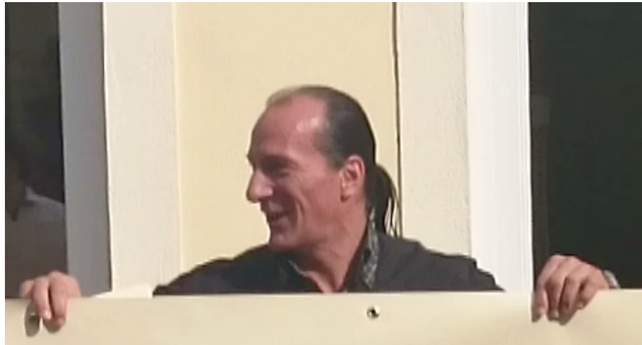
Präsentation des Kartoffelsacks durch den Impertinentor Fuzzidiar

Nachrichten aus dem "Königreich Deutschland" sind selten geworden. Allzuviel muss der Souverän bewegen, da mag die Öffentlichkeitsarbeit zu kurz kommen. Da trifft es sich gut, dass das SONNENSTAATLAND neben einem Botschafter und einem Hofspitzel auch noch einen Hofberichterstatter ins "Königreich" entsandt hat, welcher aus nächster Nähe die Feierlichkeiten zum einjährigen Bestehen der "Königlichen Reichsbank" zu Wittenberg miterlebte.