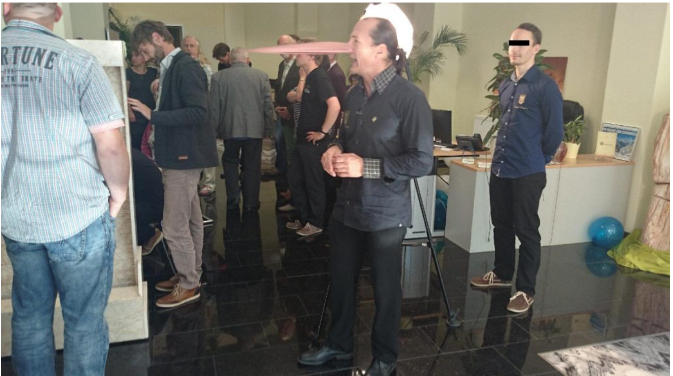
Imperator Fiduziar Peter I. verspricht die Sicherheit aller Einlagen der Königlichen Reichsbank.