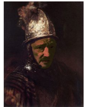
Rembrandt van Rijn Umfeld - „Mann mit

Die fünf Jahrhunderte Schaffenszeit und eine Vielzahl von Kunstepochen und Stilrichtungen umfassende Ausstellung ist in der Tat eine solitäre Ausstellung. Sämtliche bekannte Reichsdeppen-Werke wurden zusammengetragen, darunter einige weltbekannte Werke, und dürfen im altehrwürdigen Gebäude auf der Museumsinsel bestaunt werden. Trotz der überwältigenden Auswahl haben sich schon am ersten Tag einige Werke zum Publikumsliebling aufschwingen können.