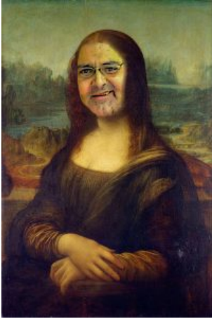
Leonardo Da Vinci - „Broila Lisa“ (1503/1506, Louvre, Paris)

Die fünf Jahrhunderte Schaffenszeit und eine Vielzahl von Kunstepochen und Stilrichtungen umfassende Ausstellung ist in der Tat eine solitäre Ausstellung. Sämtliche bekannte Reichsdeppen-Werke wurden zusammengetragen, darunter einige weltbekannte Werke, und dürfen im altehrwürdigen Gebäude auf der Museumsinsel bestaunt werden. Trotz der überwältigenden Auswahl haben sich schon am ersten Tag einige Werke zum Publikumsliebling aufschwingen können.