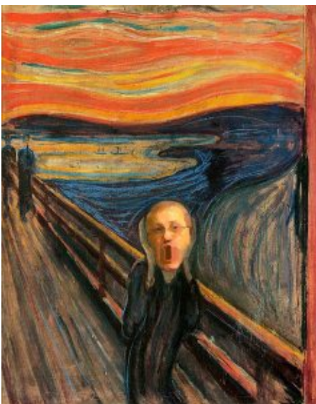
Edvard Munch - „Der Lohl-Schrei“ (1893, Munch-Museum, Oslo)

Wie zu erwarten bildeten sich vor den Ausstellungsräumen der alten Meister die längsten Schlangen. Das rätselhafte Lächeln von da Vincis Modell, sonst den Umstehenden nur von IKEA-Postern bekannt, verzauberte im Original mehr denn je. Und auch das eigentlich in der benachbarten Gemäldegalerie dauerhaft gezeigte Rembrandt-Bild „Mann mit goldenem Stahlhelm“ kann durch den in Szene gesetzten Kontext ganz neu entdeckt werden.