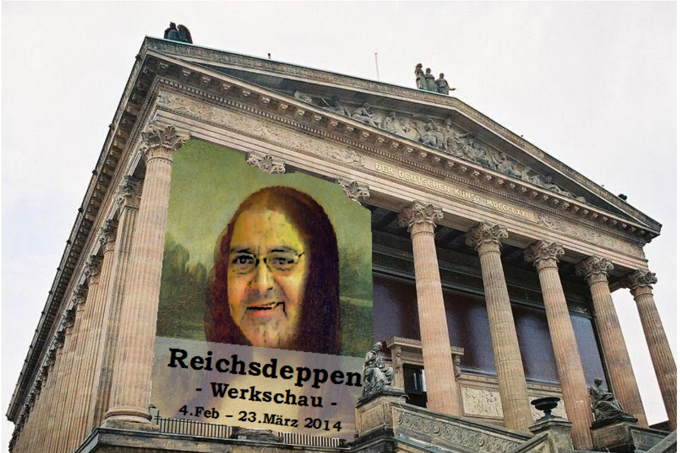
Alte Nationalgalerie - Reichsdeppen Werkschau eröffnet

Berlin - Am gestrigen Tag wurde unter großem Andrang Kunstinteressierter die von der Kunstwelt mit Spannung erwartete Reichsdeppen Werkschau in der Alten Nationalgalerie eröffnet. Aufgrund der hohen Nachfrage kam es hierbei zu teilweise unschönen Szenen im Eingangsbereich.