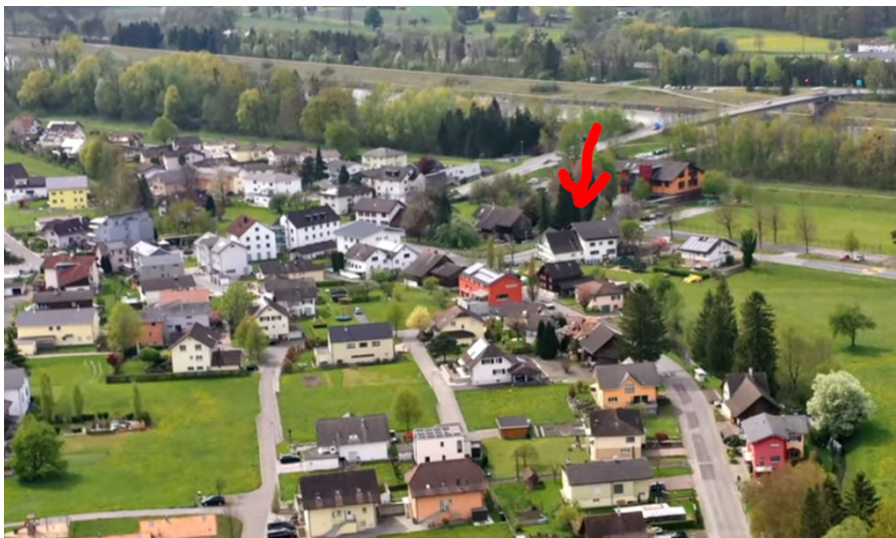
Ein Ortsteil von Ruggell mit dem Landgasthof "Rössle".