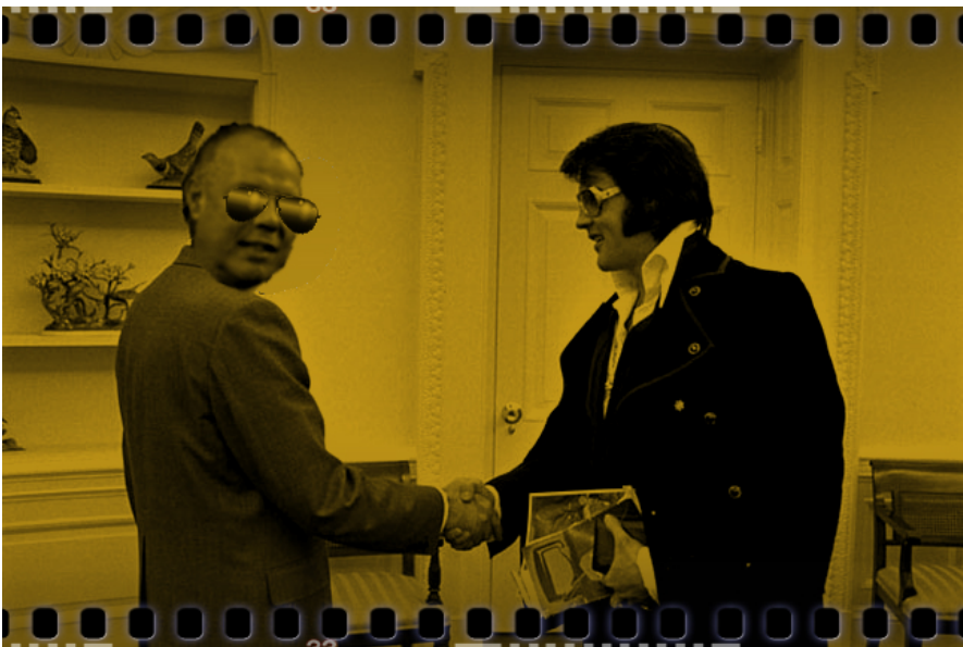
Empfang durch den King