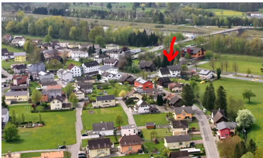
Ein Ortsteil von Ruggell mit dem Landgasthof "Rössle".